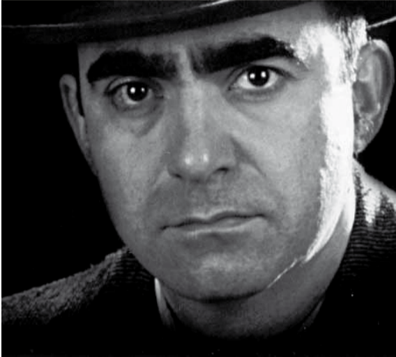
> Elio delle Storie Tese