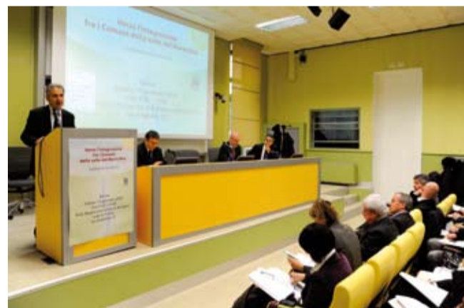
> Un'immagine della Conferenza

integrazione (il servizio del laboratorio di analisi di Pieve Sestina e il sistema unico del 118).