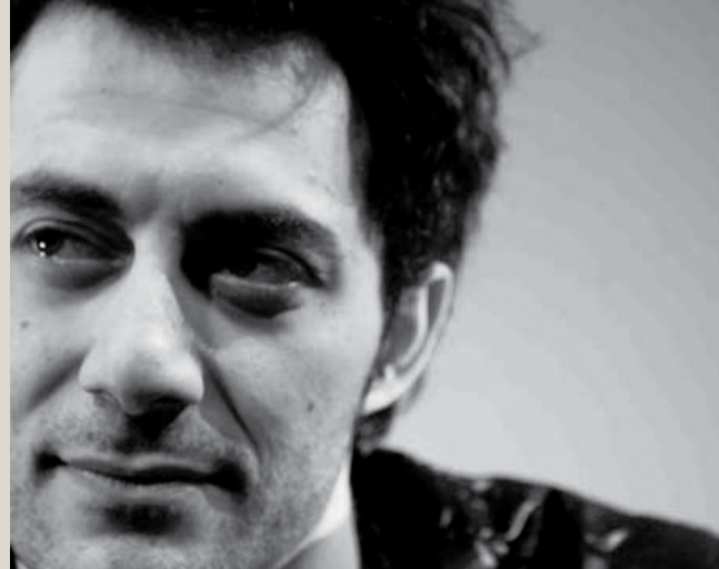
> Filippo Timi