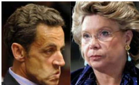
> Nicolas Sarkozy e Viviane Reding

La politica del pugno di ferro sembra sia la strada che ha scelto il governo francese per risolvere il problema dei rom presenti in Francia. Infatti, da fine luglio fino ad oggi è stato messo in atto un duro programma di smantellamento dei campi nomadi illegali e di rimpatrio "volontario" dei loro abitanti, rom con cittadinanza romena e bulgara. Sono state rimpatriate con 4 voli 828 persone che hanno ricevuto un sussidio statale di 300 euro per ogni adulto e di 100 per ogni bambino. Le espulsioni decise dal governo francese sono state fortemente