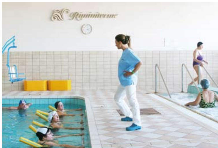
> La piscina riabilitativa con acqua di mare calda favorisce il galleggiamento facilitando i movimenti

Il controllo preventivo e l'assistenza continua da parte di medici e istruttori in Riminiterme, sono garanzia di qualità e adeguatezza ai bisogni specifici di ogni utente.