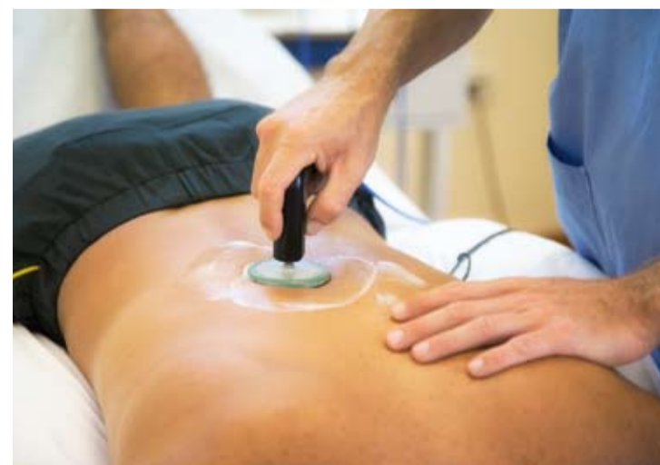
> Una seduta di Tecarterapia