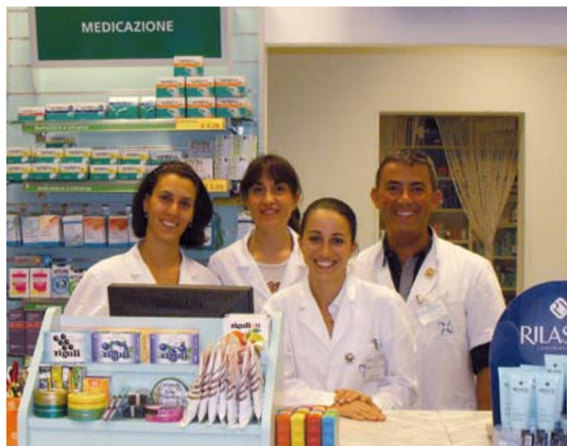
> Il nuovo staff della farmacia n. 1