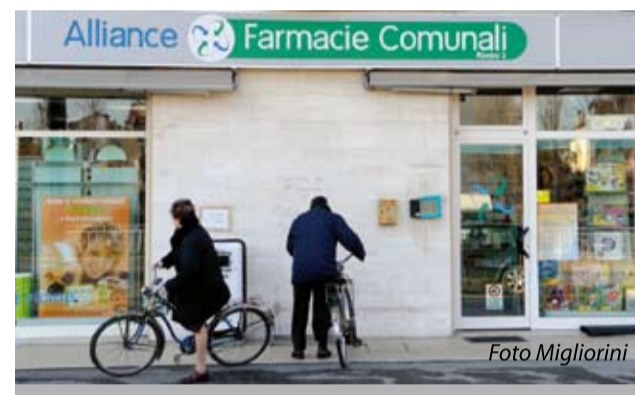
> La Farmacia Comunale n. 3

Come è stata recepita nella vostra farmacia l'Azione solidarietà?